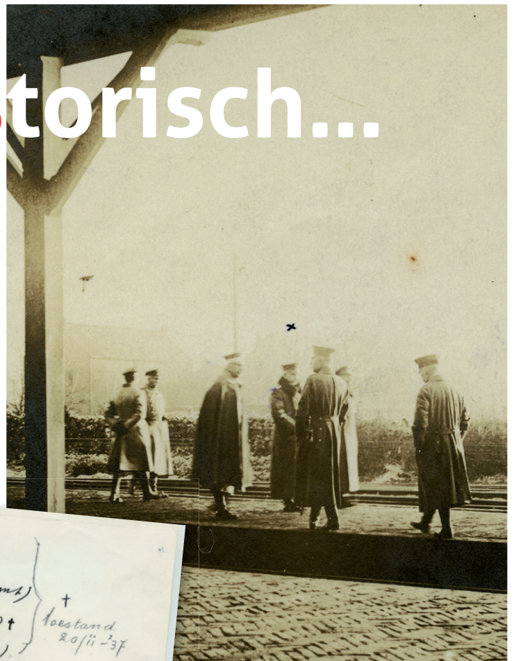
VICTOR SNIEKERS: KEIZER WILHELM MET GEVOLG OP HET STATION IN EIJSDEN, 10 NOVEMBER 1918 (UITSNEDE EN VERGROTING VAN ORIGINELE FOTO).

Paquay heeft de foto inderdaad gekregen en vervolgens naar Mooren gestuurd, met een tweede brief: